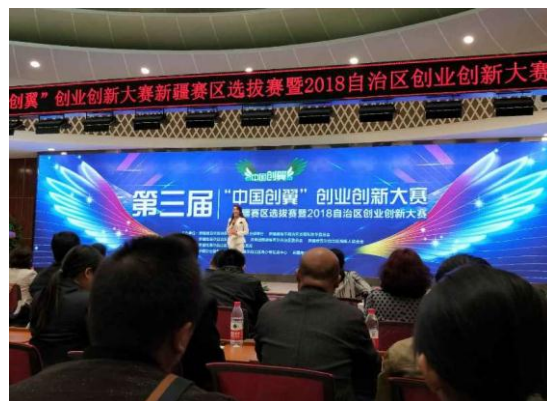
我校创客参加第三届“中国创翼”创新创业大赛新疆赛区选拔赛

学校众创空间“逐梦创客”是国家级众创空间，现有入驻创客团队34家，创客项目负责人均为我校大学生，其中科技贸易类13家、服务类16家、管理类1家、文化创意类4家。2017-2018学年，学校众创空间组织创客开展了丰富多彩的实践活动。2017年9月组织开展了“28小时创业生存训练营”活动，2017年10月举办了“新时代、新篇章”之互联网+分享——微信小程序分享会，2018年初组织“逐梦创客”部分创客深入莎车县和麦盖提县深度调研，落实相关扶贫事宜，完成了与当地政府的对接工作。2018年8月组织14名创客代表前往深圳参加了为期一周的“逐梦创业营”活动。