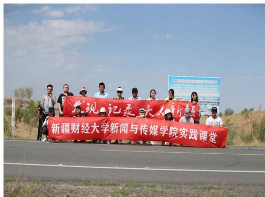
我校开展“两学一实践”暑期社会实践工作