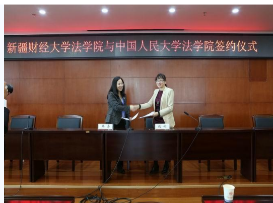
我校法学院与中国人民大学法学院签订对口支援合作协议

国际合作范围与领域不断拓展，与国（境）外高校联合培养持续推进。学校与美国威斯康辛协和大学、韩国又松大学、俄罗斯新西伯利亚经济管理大学等43所高校、学术机构及行业机构签订了合作协议，建立了合作关系。学校针对专业特色和学生发展目标，持续实施联合培养项目、校际交换项目、短期实习项目等多种形式的本科生国际合作项目。2017年我校与哈萨克斯坦阿克托别州朱巴诺夫国立大学合作共建的孔子学院，各项工作稳步发展，获“第十二届孔子学院大会先进孔子学院”称号。