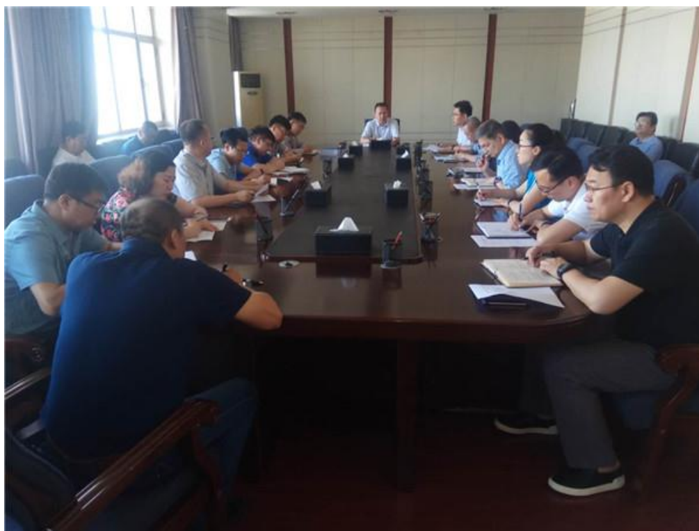
校党委副书记、校长居来提·吐尔地主持召开本科教学工作专题会议