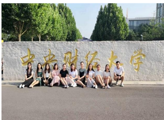
我校联合培养学生在中央财经大学交流学习

学校不断丰富完善人才培养平台，修订了《新疆财经大学本科学子转专业管理办法》，实施新的转专业管理办法，对符合条件的11名本科生进行专业调整。2017-2018学年继续选送22名学生赴中国人民大学、中央财经大学开展联合培养，我校法学院与中国人民大学法学院签订对口支援合作协议，在学术交流、师资培养、学生合作培养等方面持续深入开展合作。400余名学生经选拔进入辅修专业学习。