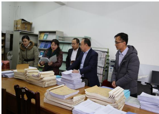
专业评估专家在学院检查指导