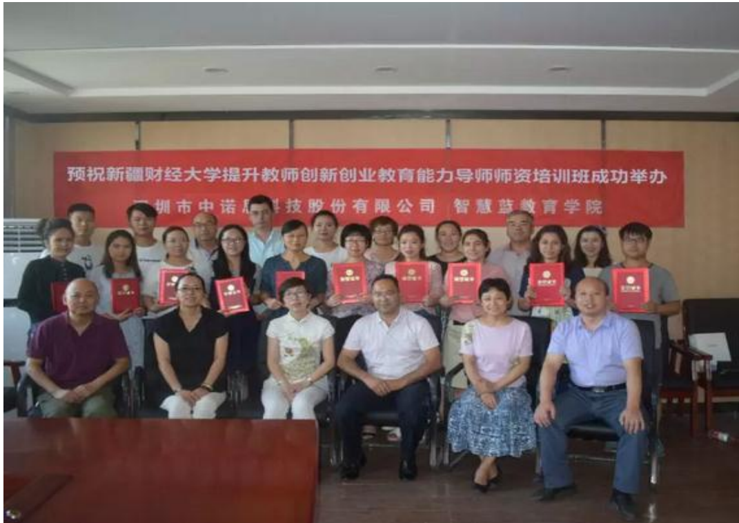
我校成功举办创新创业教育能力导师师资培训班