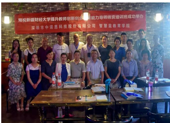
我校举办创新创业教育能力导师师资培训班

2017-2018学年，学校共选派91人次教师赴国（境）外访学、交流、培训或进修学习，其中境外交流、培训、进修22人次，国内访学3人。学校人事处、依托教师教学能力发展中心、创新创业服务中心，大力开展教师岗前培训、国培项目、“加强师德师风建设 做新时代党和人民满意的好老师”网络培训、审核评估培训、创新创业教育能力专项师资培训等各类教师培训，参与教师1200余人次。