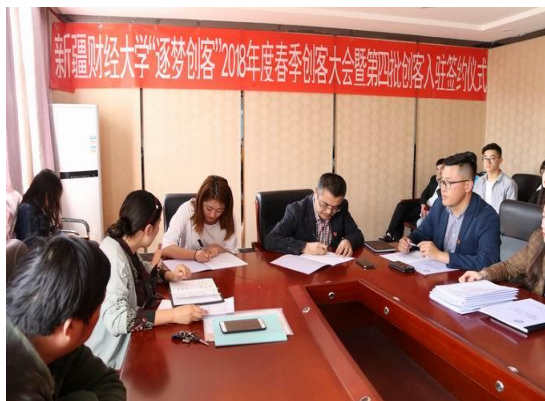
“逐梦创客”第四批创客入驻签约仪式

学校众创空间“逐梦创客”是国家级众创空间，现有入驻创客团队34家，创客项目负责人均为我校大学生，其中科技贸易类13家、服务类16家、管理类1家、文化创意类4家。2017-2018学年，学校众创空间组织创客开展了丰富多彩的实践活动。2017年9月组织开展了“28小时创业生存训练营”活动，2017年10月举办了“新时代、新篇章”之互联网+分享——微信小程序分享会，2018年初组织“逐梦创客”部分创客深入莎车县和麦盖提县深度调研，落实相关扶贫事宜，完成了与当地政府的对接工作。2018年8月组织14名创客代表前往深圳参加了为期一周的“逐梦创业营”活动。