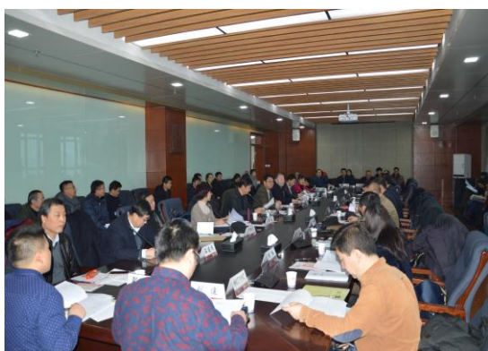
2018年1月专业评估专家见面会