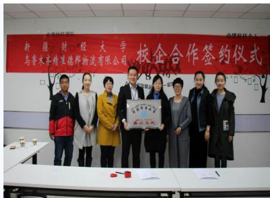
我校与德邦物流有限公司加强校企合作