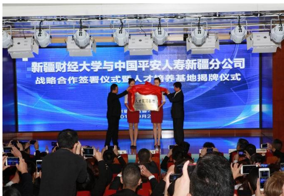
我校与中国平安人寿新疆分公司签署战略合作协议并建立人才培养基地

学校积极加强与行业企业合作，共建本科专业校外实践基地，努力把社会资源转化为育人资源，与114个单位签订了实习实训基地协议，优先安排优秀实习生顶岗实习或毕业生就业，积极探索产教融合、协同育人的人才培养路径。