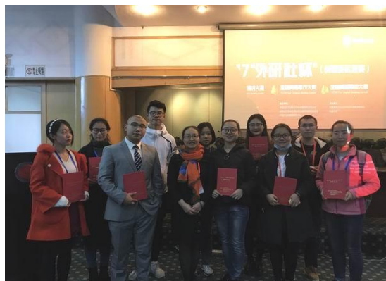
我校参加“外研社杯”全国英语挑战赛

在2017年“外研社杯”全国英语挑战赛中，我校3人荣获一等奖，2人荣获二等奖，7人荣获三等奖。在2017年全国高校商业精英挑战赛“国泰安杯”营销模拟决策竞赛暨第五届两岸三地大学生营销模拟决策竞赛大陆地区总决赛中，我校六支参赛队伍共取得大陆地区总决赛两个一等奖、两个二等奖、两个三等奖的好成绩，其中一支队伍打入了全国精英赛，我校获得最佳院校组织奖。在第二届全国大学生人力资源管理知识技能竞赛总决赛中，取得总决赛二等奖的佳绩。在“工商银行杯”全国大学生金融创意设计大赛中，我校学子斩获一等奖。在第八届全国大学生电子商务“创新、创意及创业”挑战赛决赛中，我校获得二等奖。在第五届“优优汇联杯”全国电子商务实战技能大赛中我校学生荣获二等奖。