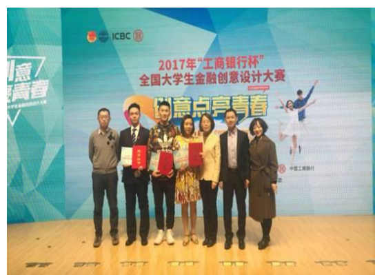
我校在全国大学生金融创意设计大赛中斩获一等奖