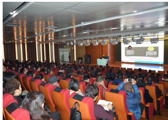
我校举办本科教学工作审核评估培训