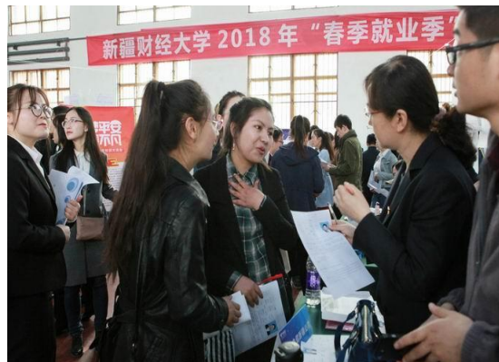
我校举行2018年首场高校毕业生“春季就业季”校园双选招聘会