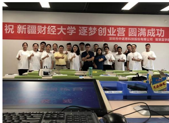
学校举办“逐梦创业营”活动