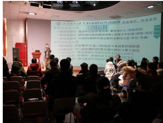
我校“天山学者”、上海财经大学 谢家平教授来校讲学

坚持人才培养与引进相结合，不断优化师资队伍结构。2017-2018学年，学校积极联系区外高校，拓宽我校引进、培养博士渠道，为今后高层次人才培养与引进奠定了基础。学校派出6名教师攻读博士学位，引进教师32名，其中博士5名。