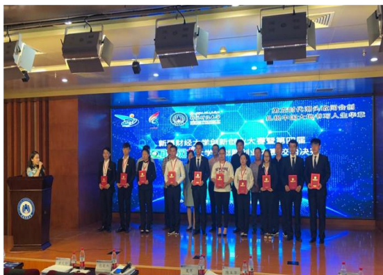
学校举办了第四届创新创业大赛暨第四届中国“互联网+”创新创业大赛校内决赛

代表高校参加第三届“中国创翼”创新创业大赛新疆赛区选拔赛暨2018自治区创新创业大赛的启动仪式。