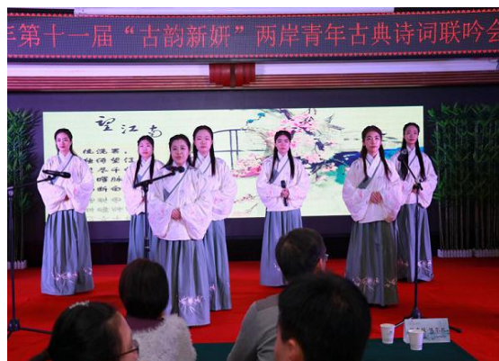
我校成功举办第十一届“古韵新妍”两岸青年古典诗词联吟大会