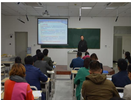
我校承办新疆高校创新创业 教育课程师资研修班

为促进自治区高校和我校创新创业教育教学改革，以转变教学理念、提升创新创业教学能力为核心，承担并圆满完成了自治区高校创业教育课程师资研修班培训工作，来自全疆 16 所本科、高职院校的 28 名教师完成了 56 个课时的研修计划顺利结业。成功承办第三届新疆“互联网+”大学生创新创业大赛工作会议暨专项师资培训会，来自全区 35 所高校代表、指导教师以及相关企业代表近 200 人参加。举办我校首届创业课程教师教学能力提升培训班，组织开展了创业教师模拟教学实训与教学研讨等活动，在我校建立起一支数量较充足、结构较合理并相对稳定的跨专业通识性创业课程教学团队。