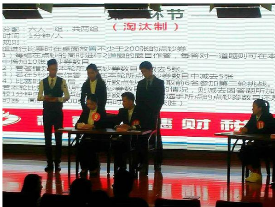
我校举办第五届“民族团结杯”点钞大赛

学校举办丰富多彩的第二课堂活动，营造良好的学术、文化氛围。2016-2017学年，举办各类文化、学术讲座273场，本科生课外科技、文化活动项目总数达186个。为了培养学生多读书、读好书的良好习惯，引导学生转变信息获取的观念和方式，图书馆举办了18场入馆教育和培训，与各大数据库公司为广大师生举办了6场数据库培训系列讲座，3000余人次学生参加了培训。