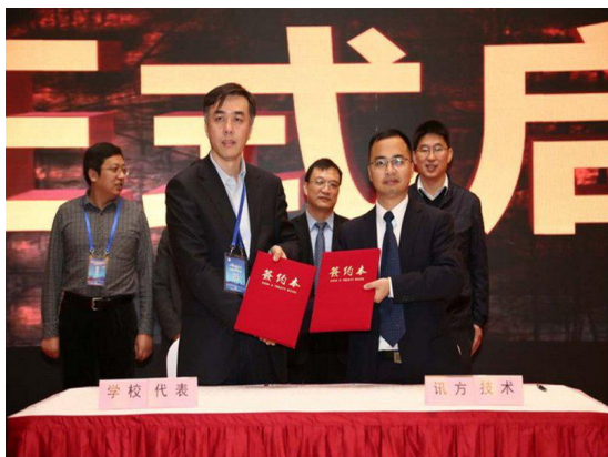
我校获批教育部产学合作、协同育人项目

为响应教育部关于深入推进产学合作、协同育人工作精神，学校申报的“云计算与大数据实训科研综合实验室”成功立项，并获得软硬件建设资助经费200万元。第二届“福思特杯”会计、税务技能大赛暨财经类专业创业实践教学研讨会成功举办，参会代表对提高财经类专业应用型人才的培养质量、高校实践教学前沿问题及学生就业问题等进行了深入的交流与研讨。为满足各专业学生实践实习需要，学校积极与多家企事业单位联系，新建数家实习基地。