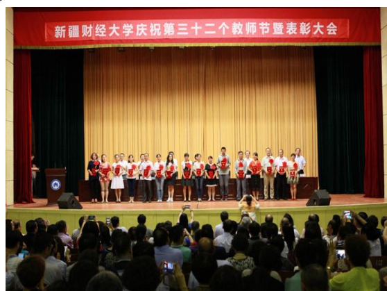
学校优秀教学质量奖、优秀教学管理奖获得者教师节大会上接受表彰