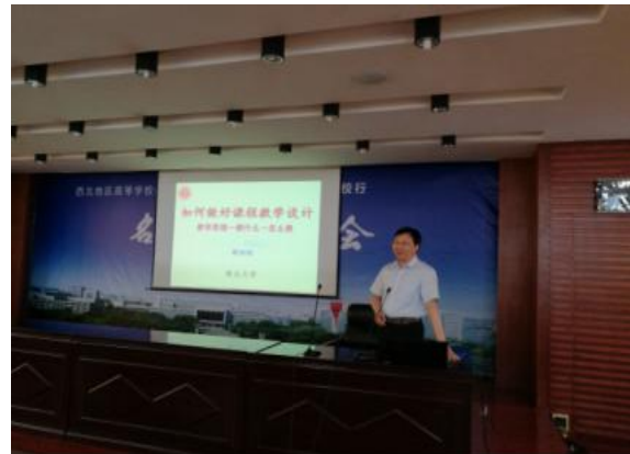
学校举办“名师西部高校行”名师报告会