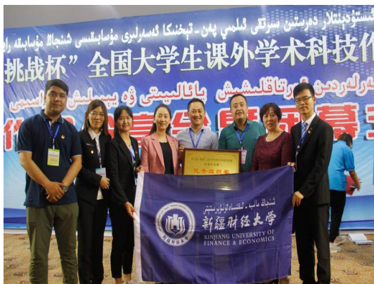
我校学生参加第十五届“挑战杯”全国大学生课外学术科技作品竞赛新疆赛区决赛

2016-2017 学年，学校积极组织学生参加各级各类学科竞赛，获得省部级以上竞赛奖励 337 项。在 2017 年度全国大学生英语竞赛（NECCS）中，我校荣获 2017 年全国大学生英语竞赛新疆赛区团体奖（A 类）第二名，获国家级奖项人数共计 172 人，其中，国家级特等奖 1 人，一等奖 11 人，二等奖 58 人，三等奖 102 人。第十五届“挑战杯”全国大学生课外学术科技作品竞赛新疆赛区决赛中，我校获得二等奖 1 项、三等奖 1 项。在中国大学生计算机设计大赛、全国大学生人力资源管理知识技能竞赛、“京东杯”第二届全国大学生物流仿真设计大赛、2017 第五届全国物流管理挑战赛、“巽震杯”第九届全国旅游院校服务技能大赛等多项竞赛中获得佳绩。