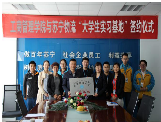
我校与苏宁物流达成合作协议， 举行实习基地挂牌仪式