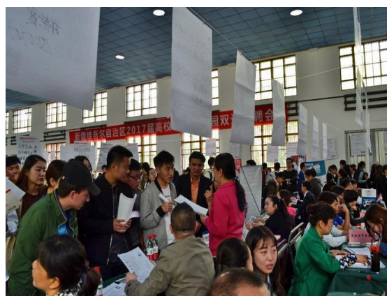
学校举办大型校园双选招聘会