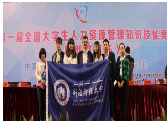
我校学生在 2016 年全国大学生人力资源管理知识技能竞赛”总决赛中获全国二等奖