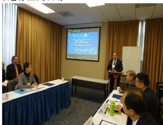
我校教师赴美开展“经济类课程翻 转教学法课堂设计与应用”培训班

2016-2017学年，学校共选派126人次教师赴国（境）外访学、交流、培训或进修学习，其中境外交流、培训、进修52人次，国内访学3人。发挥教师教学能力发展中心职能，大力开展校内教师培训，组织开展教学沙龙活动8期，围绕专业与课程建设、教学团队建设、国家通用语言文字教育教学改革等主题开展研讨；组织25名新入职教师进行上岗训练。