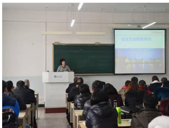
我校举办首届创业课程教师 教学能力提升培训班