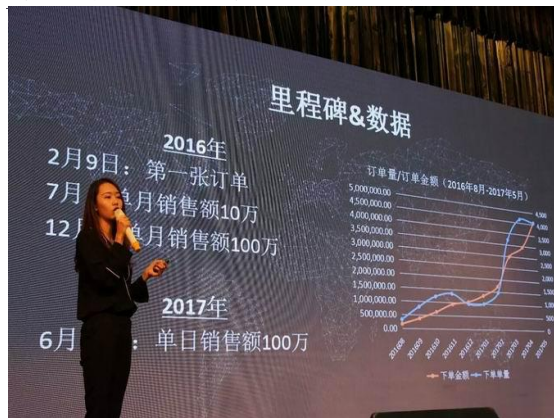
我校金奖项目在第三届中国“互联网+”大学生创新创业大赛新疆赛区颁奖仪式上汇报展示