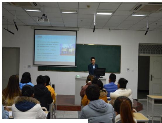
我校实施首届创业实验班