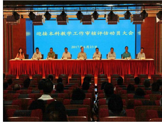
学校召开迎接本科教学工作审核评估动员大会