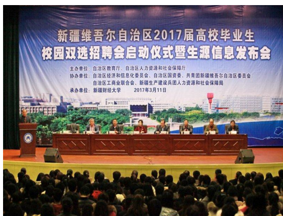
自治区 2017 届高校毕业生校园双选招聘会启动仪式暨生源信息发布会在我校举行

组织开展各种类型的招聘会 70 余场，其中大型招聘会 2 场、中型招聘会 19 场、各类小型专场招聘会 54 场；邀请用人单位 720 余家，提供就业岗位 12900 余个。推进就业服务信息化建设，充分利用校园就业网站、QQ 群、微博、微信等媒介发布招聘信息 600 余条；继续开设 SYB 创业培训班，培养学生的创业意识，激发创业激情，拓宽就业渠道。2017 届毕业生初次就业率 74.18%。