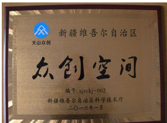
我校“逐梦创客”获批自治区首批众创空间

学校设立了专门负责大学生就业创业工作的独立机构创新创业服务中心，同时成立了虚拟设置、准市场化运营的创业学院。投入3000平米进行众创空间基地建设，积极开展众创空间“逐梦创客”的规划论证、方案设计、调研申请，成功获批第三批国家级众创空间、首批自治区级和市级众创空间。制定了《“逐梦创客”管理办法》，成立“逐梦创客”管委会，管理体制机制更加健全。截至2017年7月，我校“逐梦创客”众创空间已有入驻创客团队（项目）23个。