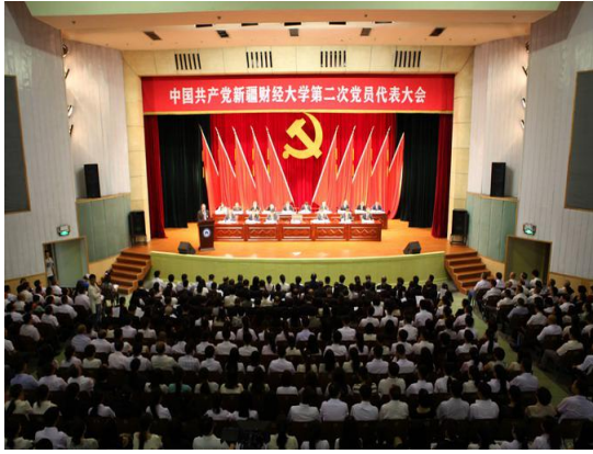
学校第二次党代会胜利召开