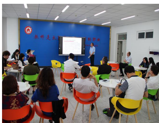
我校举办教学沙龙活动